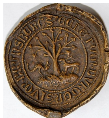
Fot. 3: Odlew odcisku XIV-wiecznej pieczęci sekretnej Braniewa