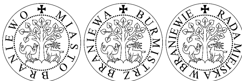
Fot. 8: Projekty pieczęci Braniewa w skali 1:1

Pieczenie mają standardową formę proponowaną dla pieczęci samorządowych.