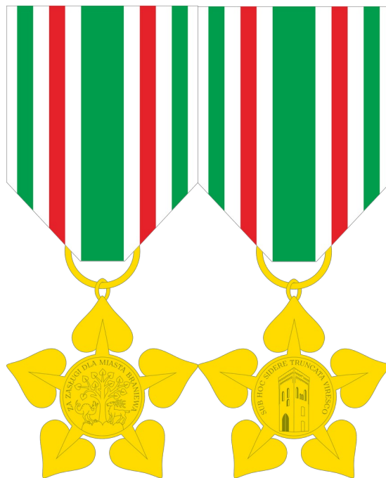
Fot. 9: Projekty Odznaki Honorowej Miasta Braniewa w skali 1:1

Forma odznaki nawiązuje oczywiście do lipy z herbu Braniewa. Dewiza po drugiej stronie odznaki to dewiza herbowa miasta Braniewa z XVIII wieku i oznacza „POD TYM ZNAKIEM NAWET ŚCIĘTE ZIELENIĄ SIĘ”.