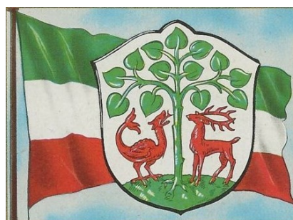
Fot. 6: Herb i flaga Braniewa na ilustracji firmy Kosmos z 1954 roku

Proponowana flaga miasta Braniewa to płąt prostokątny, o proporcjach 5:8 (szerokość do długości), podzielony poziomo na trzy pasy zielony, biały i czerwony, szerokości odpowiednio 8/10, 1/10 i 1/10 szerokości płata, z umieszczonym centralnie herbem miasta Braniewa wysokości 8/10 szerokości płata.