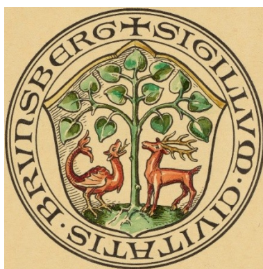
Fot. 2: Projekt pieczęci Braniewa autorstwa Ottona Huppa z 1932 roku